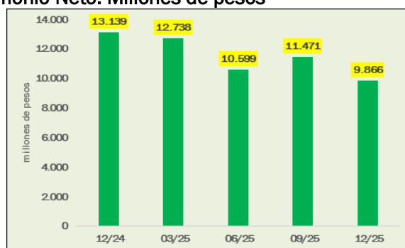
Gráfico 2 - Evolución del Patrimonio Neto. Millones de pesos

El Patrimonio Neto del Fondo al 30/12/2025, alcanzó un monto de $9.866 millones. El Gráfico 2 presenta la evolución para los últimos 5 trimestres.